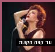
עד קצה הקשת