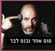
סוס אחד נכנס לבר