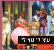
עוץ לי גוץ לי