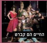
החיים הם קברט