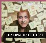
כל הדברים הטובים